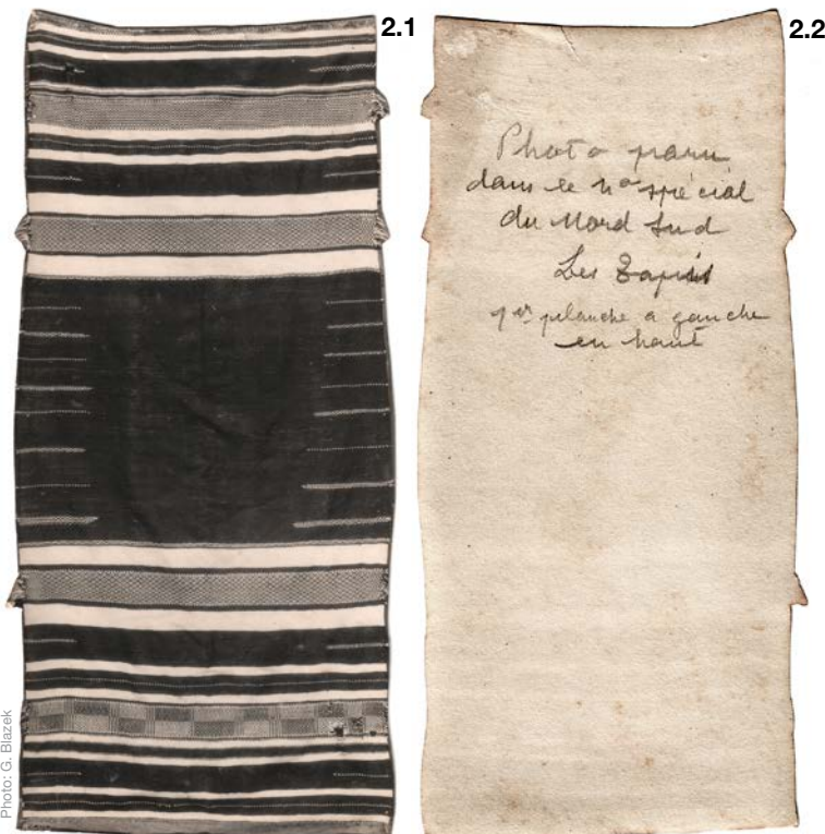
Lahmal shadouï with dark middle section, published in 1934 and 1935 by Prosper Ricard in Nord-Sud, with a hand-written note on the back of the photo – probably written by Ricard himself. Lahmal shadouï mit dunklem Mittelteil, publiziert 1934 und 1935 von Prosper Ricard in Nord-Sud, mit handschriftlicher Bemerkung auf der Fotorückseite – wohl von Ricard persönlich.

Im Zentrum des Gebietes pilgern jährlich Berberinnen nach Anzal im Territorium des Unterstammes der Ait Tamassine zum Fest (moussem) der Lala Tlaitmaze. Sie war die Tochter des aus der großen Palmenoase des Tafilalet stammenden Gründers einer Bruderschaft (Zaouia) und lebte im frühen 16. Jahrhundert. Sie wird als diejenige Person verehrt, die die Knüpfkunst in die Region brachte. Diese Oasenregion mit dem historischen Zentrum >